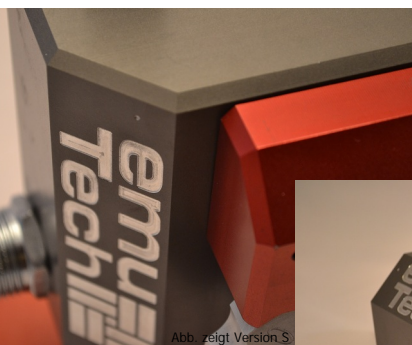
Abb. zeigt Version S